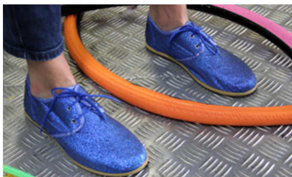
Mon Cycliste | hall4 D137