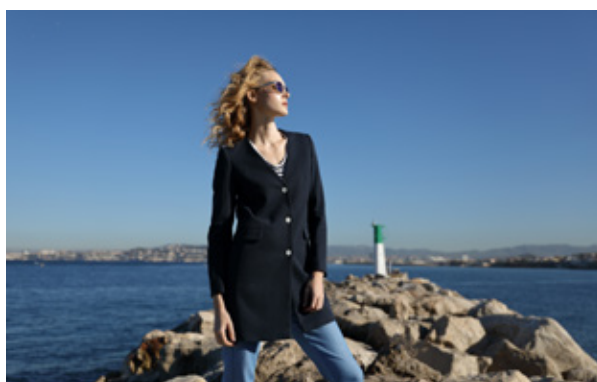
Trench &amp; Coat | hall 4 / C19

Cet espace sera l'occasion de découvrir que le sur mesure est une tendance de fond désormais accessible pour les marques françaises moyen de gamme. Dans une société, où la fast-fashion internationale nous inonde de produits, le sur-mesure français gagne du terrain car les acheteurs sont de plus en plus soucieux de la qualité.