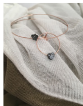
Romane Petrosino | hall 3 G48 / F49