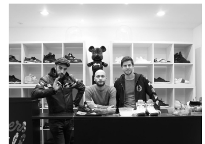
SNEAKERS & CHILL

Atelier Meraki sur Instagram , Facebook et Twitter .